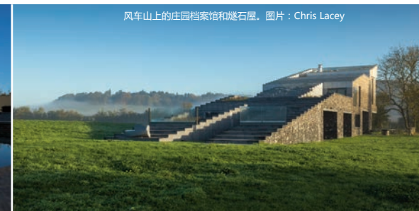
风车山上的庄园档案馆和燧石屋。