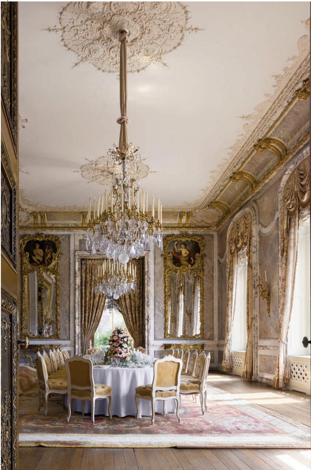
沃德斯登庄园餐厅、红色会客厅以及灰色会客厅